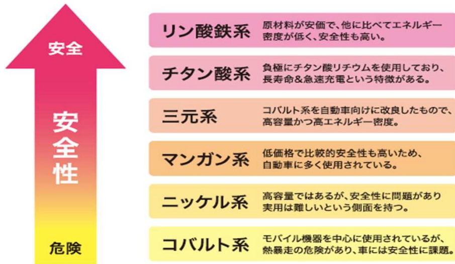
[リチウムバッテリーの種類と安全性]

また自己放電率は月に約3%ほどなので、長時間放置していても十分な電力を得ることが可能です。